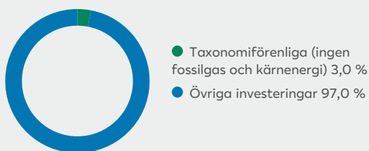
1. Taxonomiförenlighet hos investeringar, inklusive statliga obligationer*

De två diagrammen nedan visar i grönt minimiprocentandelen investeringar som är förenliga med EU-taxonomin. Eftersom det inte finns någon lämplig metodik för att avgöra hur taxonomianpassade statliga obligationer är*, visar den första grafen taxonomianpassningen med avseende på alla den finansiella produktens investeringar, inklusive statliga obligationer, medan den andra grafen visar taxonomianpassningen endast med avseende på de investeringar för den finansiella produkten som inte är statliga obligationer.