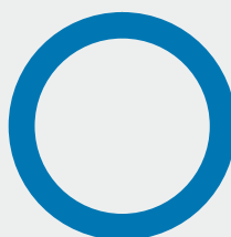
2. Taxonomiförenlighet hos investeringar, exklusive statliga obligationer*

● Taxonomiförenliga (ingen fossilgas och kärnenergi) 0,0 % ● Övriga investeringar 100,0 %