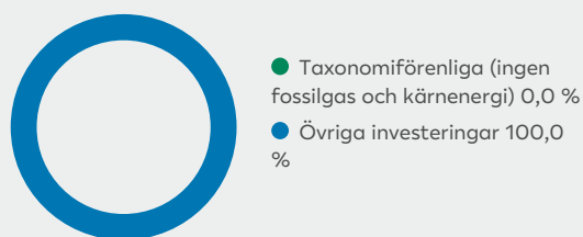
2. Taxonomiförenlighet hos investeringar, exklusive statliga obligationer*